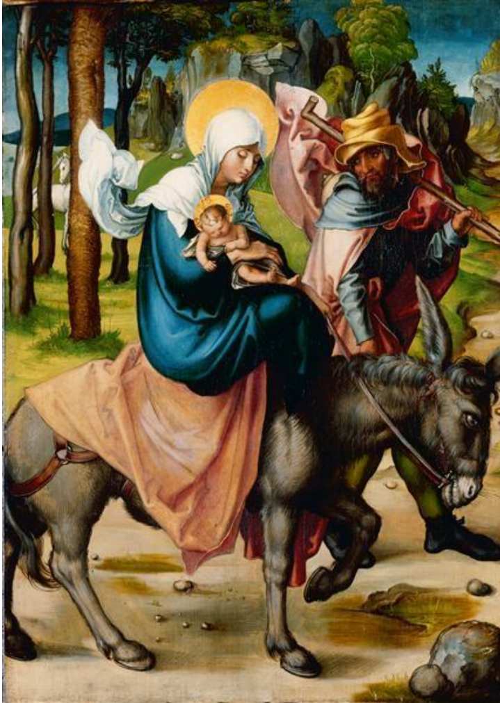
Jozef en Maria met kindje Jezus op de vlucht voor Herodes naar Egypte